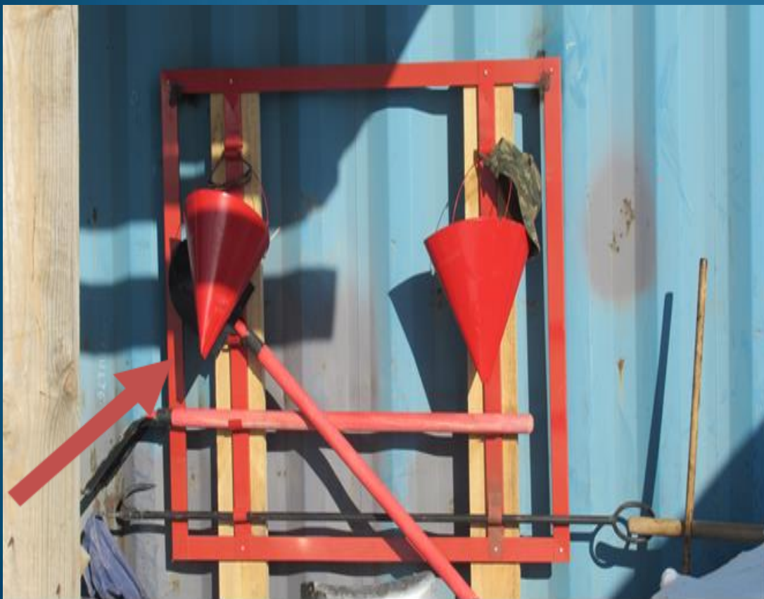
Щит пожарный класс А

6. Не установлены на территории стройплощадки пожарные щиты (стенды), либо не укомплектованы в полном объеме пожарным оборудованием и инвентарем